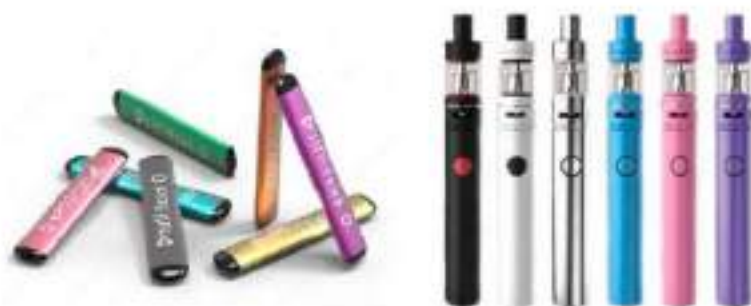
Рис. 5. Одноразовые (слева) и многоразовые (справа) электронные сигареты

Одноразовые ЭС рассчитаны на 200 - 500 затяжек пара. В многоразовых устройствах нет таких ограничений и они работают до тех пор, пока доливается жидкость в емкость.