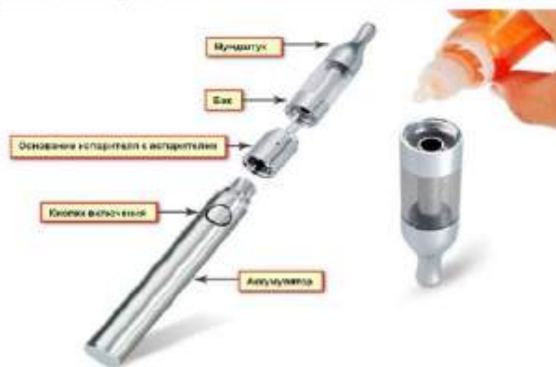
Рис. 3. Устройство электронной сигареты

Обычная электронная сигарета состоит из аккумулятора, электрического испарителя, емкости для жидкости, мундштука и дополнительных элементов для автоматического управления подачей ароматизированной жидкости (но последние имеются не во всех моделях), рис.3.