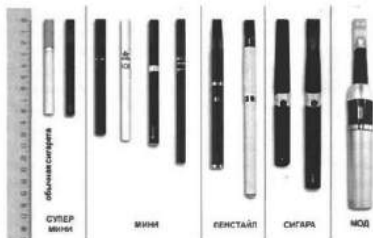
Рис.4. Типы и размеры электронных сигарет

Электронные сигареты (вейпы) классифицируются также по типу и размеру (рис.4) в соответствии с длиной (от 82 мм до 175 мм).