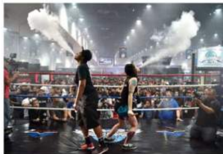
Рис. 2. Вейпинг соревнование

Быстрому распространению курения ЭС (вейпингу) способствуют компании-производители, которые превратили курение ЭС в целую субкультуру. В мире на регулярной основе проводятся субсидируемые компаниями-производителями выставки и соревнования среди курильщиков ЭС (рис.2). Это так называемые: «Cloudchasing» (мастерство выдувания облаков пара), «Tricks» (трюки с паром) и «Вейпинг-алхимия» (соревнования по составлению новых жидкостей для вейпа).